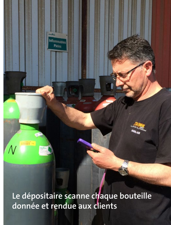
Le dépositaire scanne chaque bouteille donnée et rendue aux clients

Air Products jouit d'une réputation hors